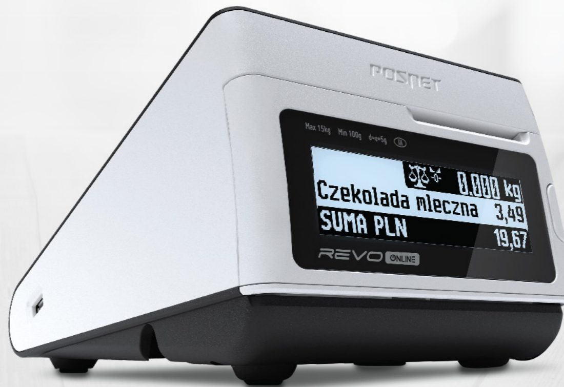
Kasa Posnet Revo ONLINE