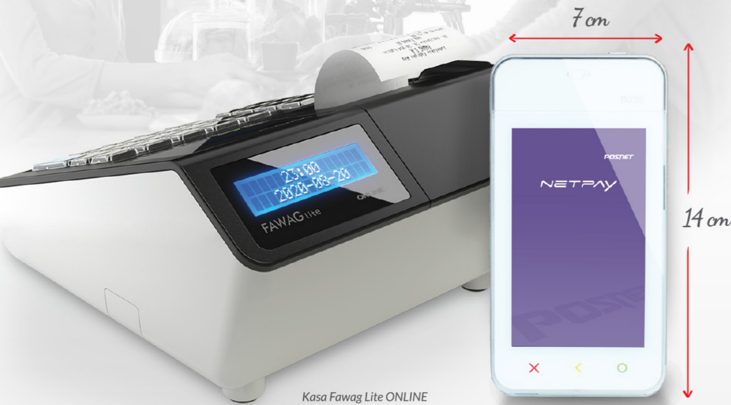
Kasa Fawag Lite ONLINE

Terminal płatniczy Netpay, w połączeniu z kasami fiskalnymi ONLINE Posnet i Fawag pozwala szybko i prosto realizować płatności bezgotówkowe.