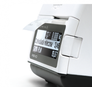
Mechanizm drukujący z obcinaczem