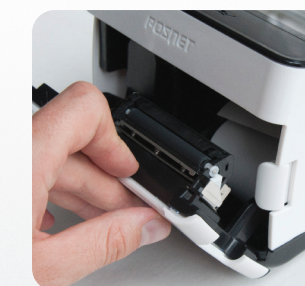
Łatwa wymiana papieru „drop in - wrzuć i drukuj”