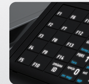
Podświetlana, odporna na zachlapania klawiatura