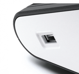
Archiwizacja danych na pendrive